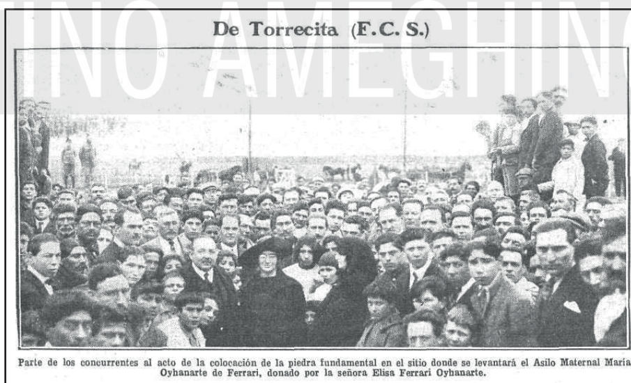
Revista “Caras y Caretas”.

No tenemos la resolución oficial de la petición pero claramente el gobierno municipal no ha de haber recibido contestación favorable por parte del Ministerio de Gobierno bonaerense porque la Manzana 64 tuvo otro destino –que no fue precisamente el de plaza sino que terminó por lotearse la mitad y la otra mitad del te-