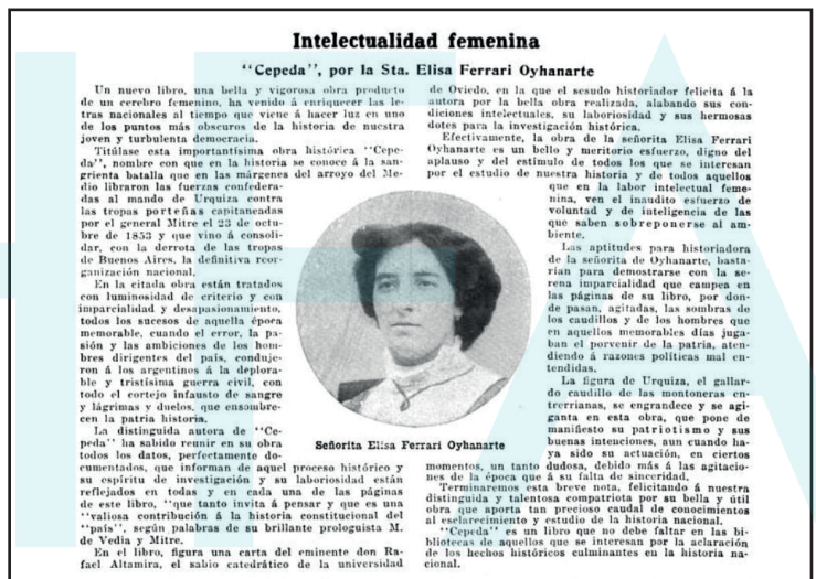
Revista “El Hogar” de 1910.

13 ‘El Hogar’ fue una revista argentina fundada en 1904 por Alberto M. Haynes y editada por la Editorial Haynes. Comenzó siendo una revista quincenal, literaria, recreativa, de moda y humorística, que luego cambió su temática y se centró en aspectos ‘sociales’ de las familias de clase alta, las ‘más tradicionales’ del país. Allí fue cuando obtuvo éxito y adoptó características de semanario ilustrado. “El Hogar fue por mucho tiempo la revista de mayor venta y el público reconocía en ella a la publicación más identificada con un incipiente estilo de vida nacional”. Además, “fue la pionera que sacó a las revistas argentinas de los límites del país al tener difusión internacional. ‘El Hogar’ llegaba a los principales centros del mundo como algo más que un semanario impreso en Buenos Aires; era también una publicación elaborada por argentinos, que hacía conocer firmas, literatura y pensamiento argentino”.